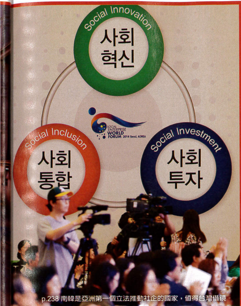
p.238 南韓是亞洲第一個立法推動社企的國家，值得台灣借鏡。