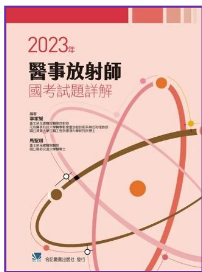
2023 年醫事放射師 國考試題詳解 -放射診斷科 FC000675