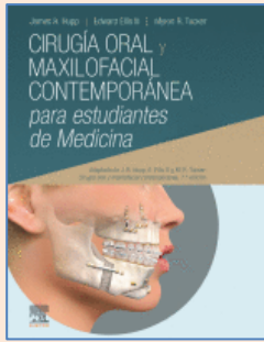
Cirugía oral y maxilofacial contemporánea para estudiantes de Medicina