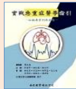
實戰急重症醫學指引