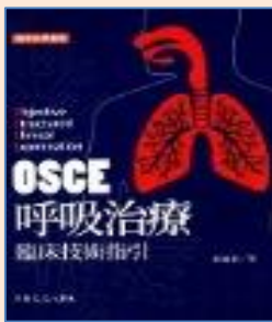
OSCE 呼吸治療臨床技術指引