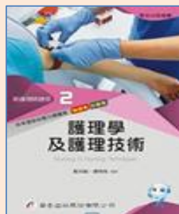
護理學及護理技術