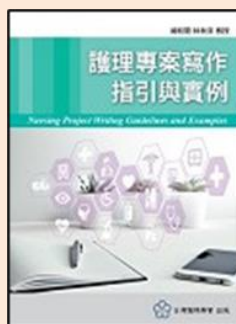
護理專案寫作指引與實例