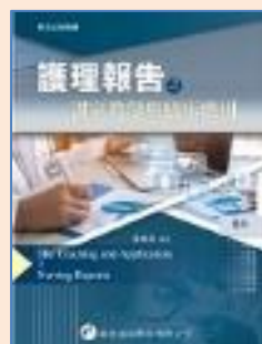
護理報告之課室教學與臨床應用