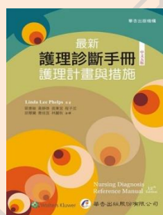
最新護理診斷手冊