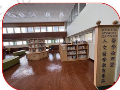
醫學人文倫理教育專區

專區圖書新增及借閱依據依據「圖書館管理作業準則」，全區圖書提供外借，增購書刊經「醫學人文中心人文藝術小組」審核開會討論後，呈准醫教會主席同意請購。