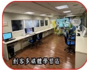
創客多媒體學習區