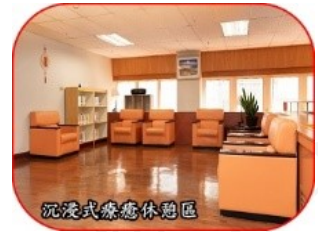
沉浸式療癒休憩區