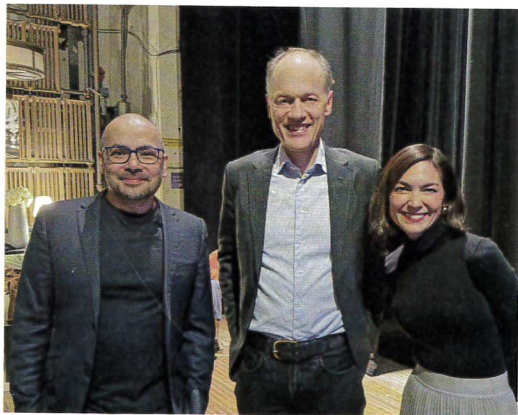
哈薩比斯(左)、馬拉比(中)