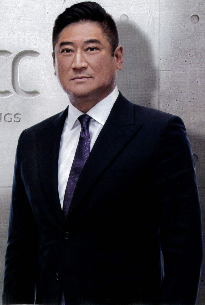
中信金大股東 辜仲諒