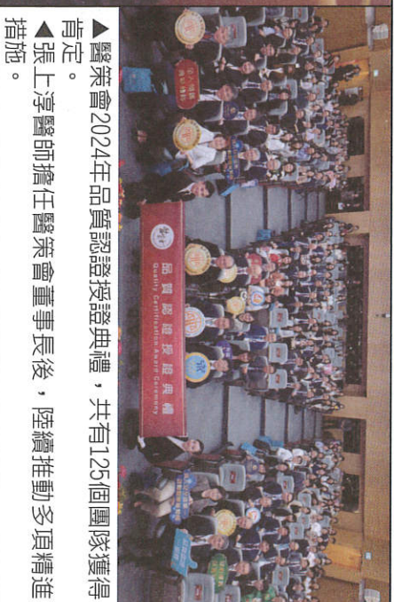
▲醫策會秉持傳遞卓越醫療價值的精神，持續深耕品質認證。