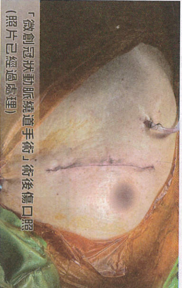
「微創冠狀動脈繞道手術」術後傷口照 (照片已經過處理)