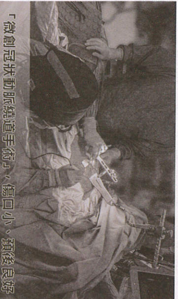
「微創冠狀動脈繞道手術」傷口小、預後良好

陳主任提醒，「微創冠狀動脈繞道手術」雖然有上述優點且能做到多條冠狀動脈繞道，但仍可能出現術後併發症，因此請先與您的主治醫師評估討論後再做決定。