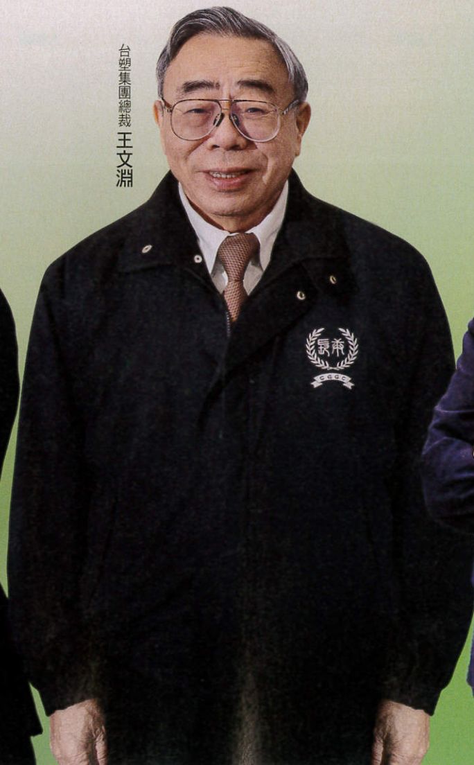
台塑集團總裁 王文淵