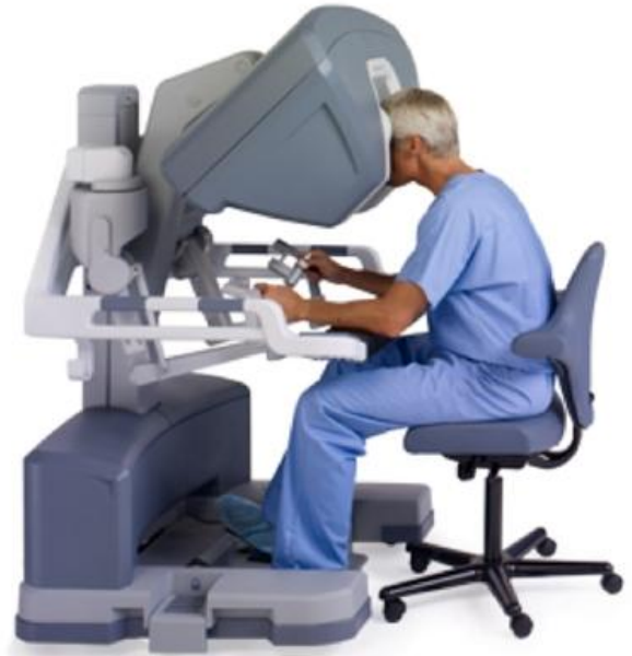
圖一： 達文西機械人手臂能夠提供更細膩及精準的切割及縫合

以攝護腺癌來說，近 20 年來，台灣 50 歲以上男性，攝護腺癌發生率與死亡率都上升了兩倍至三倍之多。雖然罹癌人數及死亡人數尚較歐美等國低了許多，但仍有逐年上升的趨勢。而歷年來台灣男性罹患攝護腺癌人數持續增加的原因應該與逐漸增加的 PSA 篩檢有關，其中又以早期攝護腺癌為主。而早期攝護腺癌的標準治療還是以根除性手術為首。由於攝護腺位於骨盆腔的最底部，對傳統開腹手術造成相當大的困難；此外，攝護腺切除後需要行膀胱及尿道的接合，此步驟更是腹腔鏡手術最難克服的地方。達文西機械人手臂能夠提供更細膩及精準的切割及縫合，不僅能有很高的腫瘤控制率，術後的尿失禁比例及性功能喪失情形都能降到最低。