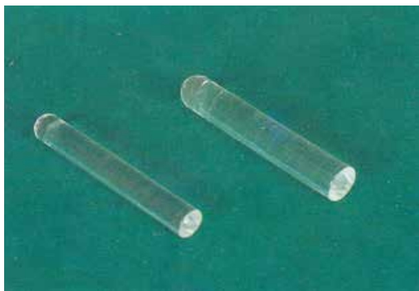
圖一 不同尺寸的壓力棒

於放射治療結束後，依照醫師的指示使用。每天 1~2 次，每次 15~20 分鐘，於沐浴或休息時皆可使用。