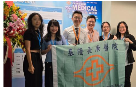
基隆長庚中醫科團隊