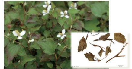
↑魚腥草原貌、飲片，圖片來源：衛福部《臺灣中藥典》

衛生福利部中醫藥司《臺灣中藥典》暨圖鑑資料庫（第四版）、 中華民國藥師公會全國聯合會《藥學雜誌》第120冊（電子報）、醫砭。