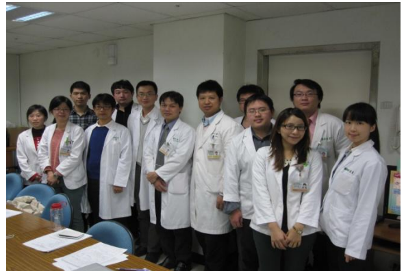
基隆長庚中醫科醫療團隊