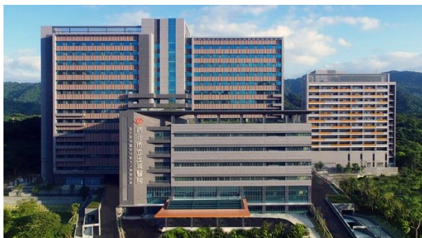
新北市政府委託長庚醫療財團法人興建經營 「新北市立土城醫院」