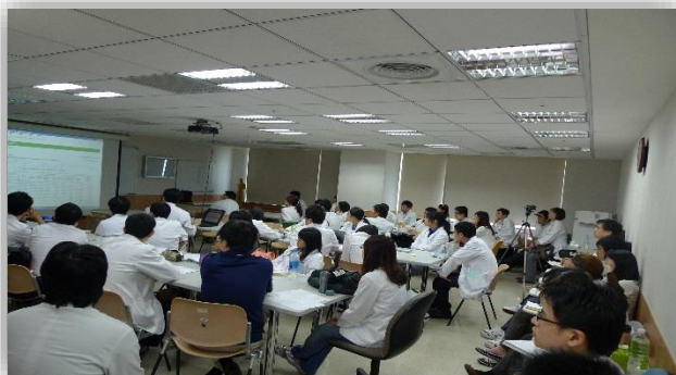
中醫部醫師教育訓練學術活動