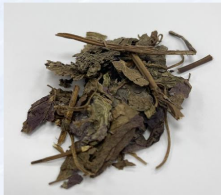
◎紫蘇葉：行氣寬中，泡水飲用可作為止嘔藥物