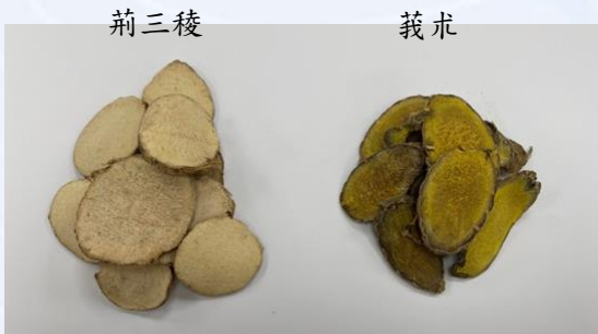
◎ 荊三稜及莪朮，主要用在氣滯血瘀的月經不來、下腹腔有腫瘤積聚等症狀，在懷孕時需慎用藥物。

在處理covid-19的感染上，大致可分為幾個目標：呼吸及皮膚系統的氣機協調、腸胃系統的消化吸收及排泄、肝腎系統的疏瀉運作等，但考量到懷孕女性的氣血分佈，妊娠禁忌、慎用藥物，如行氣效果的陳皮、木香、砂仁；活血的紅花、牛膝、益母草等都需要小心使用；荊三稜及莪朮亦為婦科常用的活血破血用藥，主要用在氣滯血瘀的月經不來、下腹腔有腫瘤積聚等症狀，兩者都入肝脾經，但因孕婦體內有胎兒，所以在懷孕時這兩味藥就為妊娠的慎用藥物。