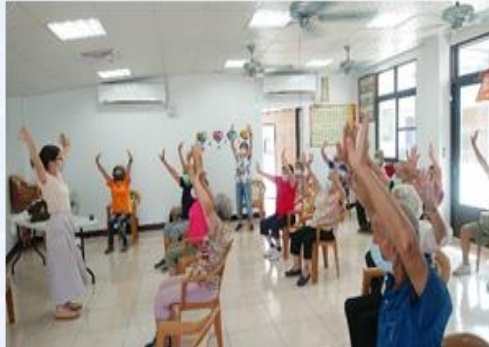
中醫師教導長者養生運動