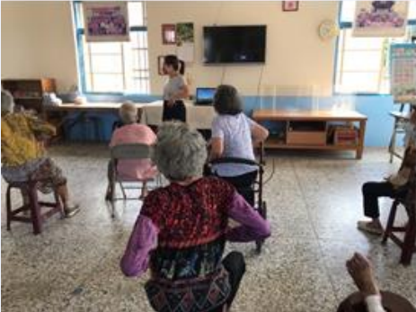
指導長者練習皮拉提斯呼吸法