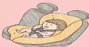
嬰兒用座椅 <1Y <10KG