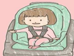
幼童用座椅 1~4Y 10~18KG