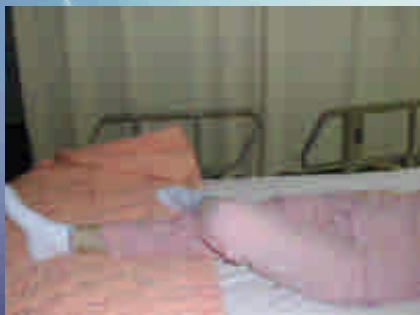
側臥兩腿間沒夾枕頭