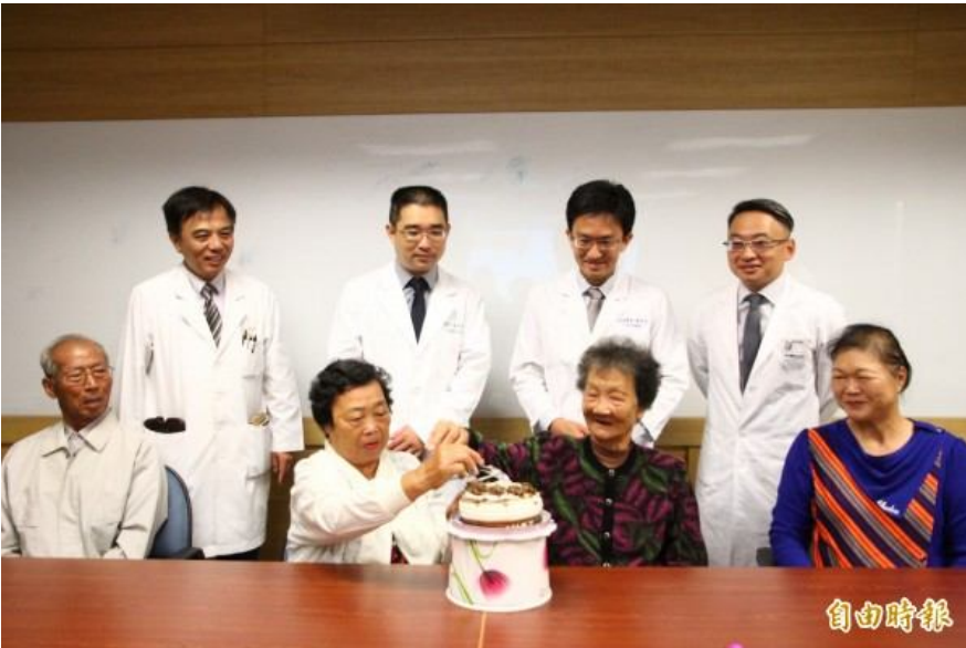
兩位中風的阿嬤經動脈內血栓清除術，恢復原有功能。

〔記者林宜樟 / 嘉義報導〕台灣平均每44分鐘有1人死於腦中風，更是造成殘障主要原因，過去中風病人使用靜脈注射血栓溶解劑治療，但需在中風後3小時內注射，嘉義長庚醫院推動新一代動脈內血栓清除術，以支架拉取或抽吸，中風超過6小時仍有機