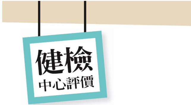
表13 長庚、台大印象分數最好

問：依你的經驗或印象，請問你心目中台灣哪一家健康檢查中心表現最好？（開放題，有回答哪家健檢中心表現最好者，扣除不知道 / 未回答，%）