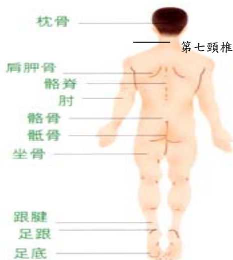
圖一、仰臥位身體骨突處部位