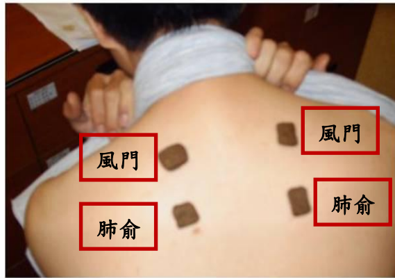
圖一 穴位敷貼藥餅

穴位敷貼是將中藥製成藥餅後，貼敷於穴位上的一種治療方式，目前最常使用的是在「三伏天」及「三九天」實施穴位敷貼療法。根據中醫『春夏養陽』、『寒者溫之』的原則及「天人相應」、「冬病夏治」的觀念，在夏季的「三伏天」及寒冬的「三九天」，於背部特定的穴位，如大椎、風門、肺俞、脾俞、腎俞、大腸俞等穴貼上溫補、定喘、逐痰、祛寒、止咳功效的藥餅（如圖一），以達到疏通經絡、調節臟腑機能目的。