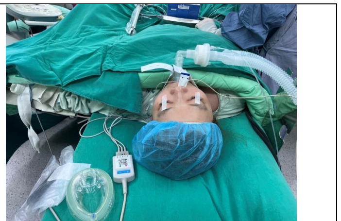
左手用手架保護，ON IV。 上 IVG 時，收右手量腋溫。