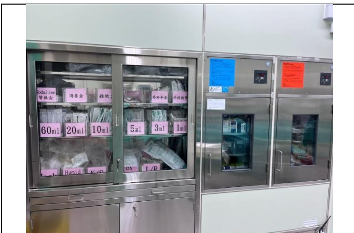
靜脈注射用物、大量點滴及空針皆由生殖中心提供