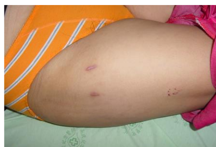
圖五 髖關節鏡手術後傷口