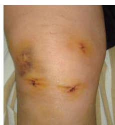
圖二 膝關節鏡手術後傷口