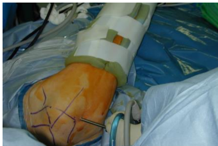
圖三 肩關節鏡手術

肩盂及肩盂唇之病變、肩關節旋轉肌腱破裂、關節囊沾黏、關節內游離體等病人。另外臨床上復發肩關節脫白的病人，大多數併有肩盂唇裂傷，可在關節鏡下，使用帶線錨釘，再將裂開的肩盂唇復位縫合，治癒率高且功能復原良好。