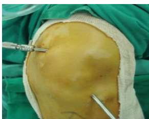
圖一 膝關節鏡手術

膝關節鏡檢查及治療(圖一)，適用於膝關節內之半月板受傷、十字韌帶斷裂及關節軟骨受傷病人，可採住院或門診手術，如果只是執行膝關節檢查，在膝關節之髕骨韌帶內側及外側，各有一個 0.5 公分大小的傷口；膝關節鏡手術，則依病情不同在膝關節處會增加其它小傷口以進行手術(圖二)。