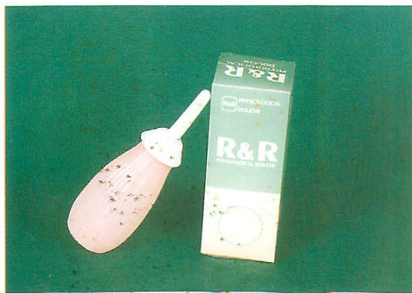
▲ (圖一) 婦科沖洗器