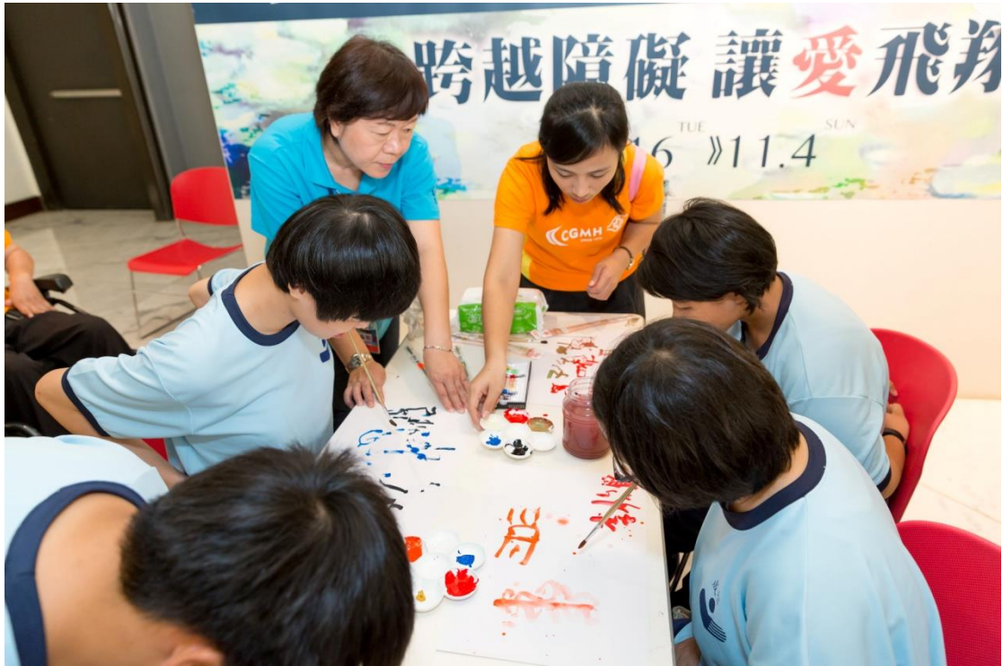
邀請學童現場體驗口足作畫