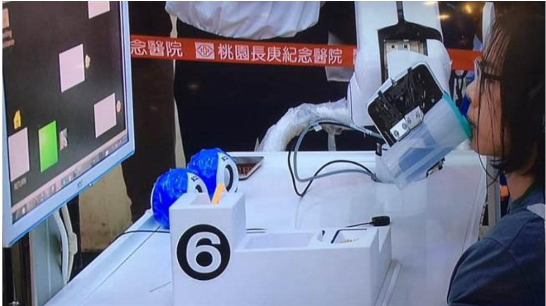
參賽機器人能協助餵食病患。

長庚紀念醫院創院至今 40 週年，今天在院內舉辦國內首次醫療機器人比賽，共有 18 組隊參賽，包括能協助手術、幫病患復健、協助診察的醫療機器人，希望透過比賽能激發社會各界對於醫療機器人的研發創意，帶動國內醫療及照護機器人產業發展。