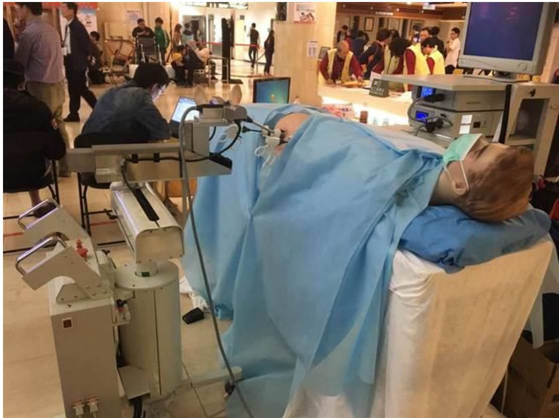
參賽機器人能協助手術。