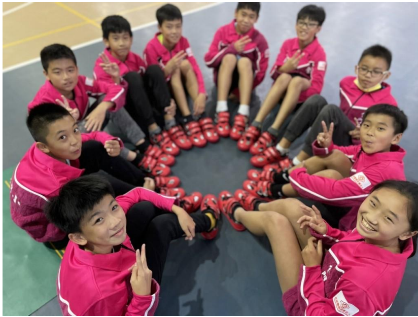
長庚醫院透過贊助偏鄉拔河隊推廣拔河運動發揚團隊精神。