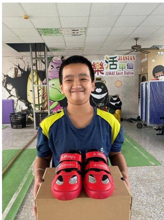
甲仙國小拔河隊學生拿到新的拔河鞋滿足的與新鞋合影。

塋國小、豐裡國小、高寮國小；宜蘭縣三星國中、三星國小；南投縣宏仁國中；高雄市甲仙國中、甲仙國小及金門縣金湖國小。