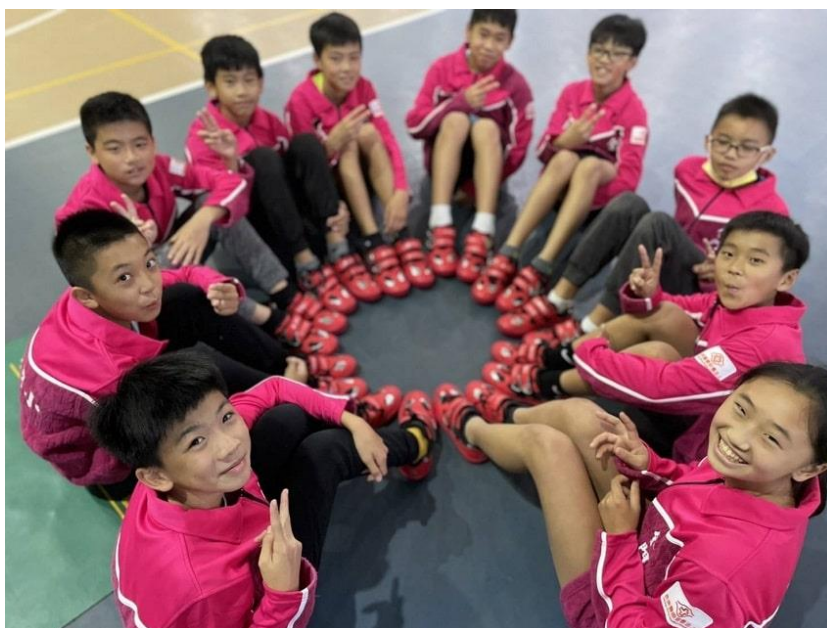
長庚醫院透過贊助偏鄉拔河隊推廣拔河運動發揚團隊精神。

長庚醫院自 2018 年起，以舉辦長庚拔河訓練營、永慶盃拔河比賽、贊助偏鄉學校拔河隊等方式推廣拔河運動，發揚團隊精神，至今已贊助 15 所偏鄉學校、累積逾千雙拔河鞋，成為偏鄉拔河隊最暖心的後盾。長庚醫院今天表示，再贊助 192 雙拔河鞋給這些偏鄉拔河隊，讓他們持續改善裝備，發揮實力，贏取佳績。