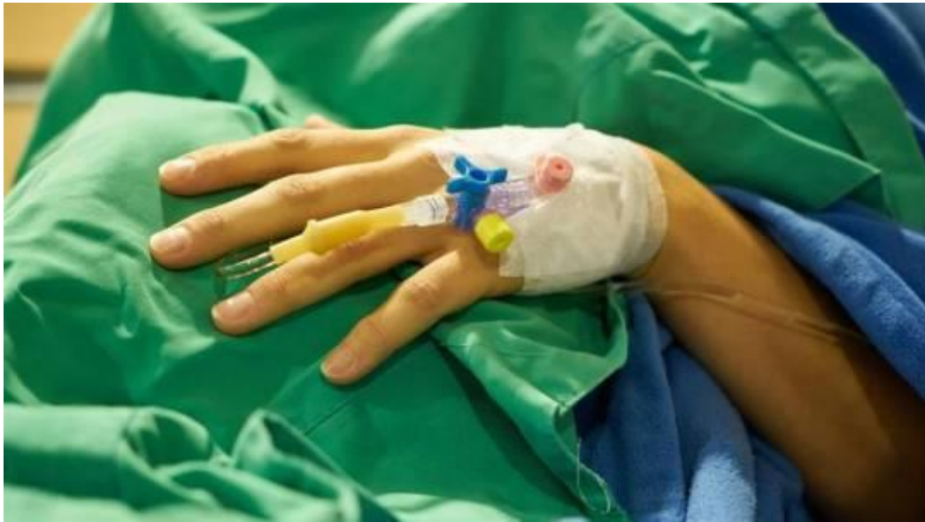
▲「爸要放手了」兒車禍救不回 老父顫抖簽器捐：我的心肝寶貝

面對家人生命來到最後一刻時，忍痛放手是一件相當艱難的抉擇。近期有一名男子發生嚴重車禍被送到急診，年邁的老父親得知兒子的狀況不樂觀後，決定讓兒子遺愛人間，顫抖地簽下器捐同意書，「兒子，爸爸要放手了。」畫面令人鼻酸。