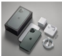
行動電話及其充電器 (包括座充及旅充)