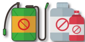
環境衛生用藥 及農藥廢容器